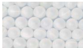
Floating balls / Boules anti-vapeur