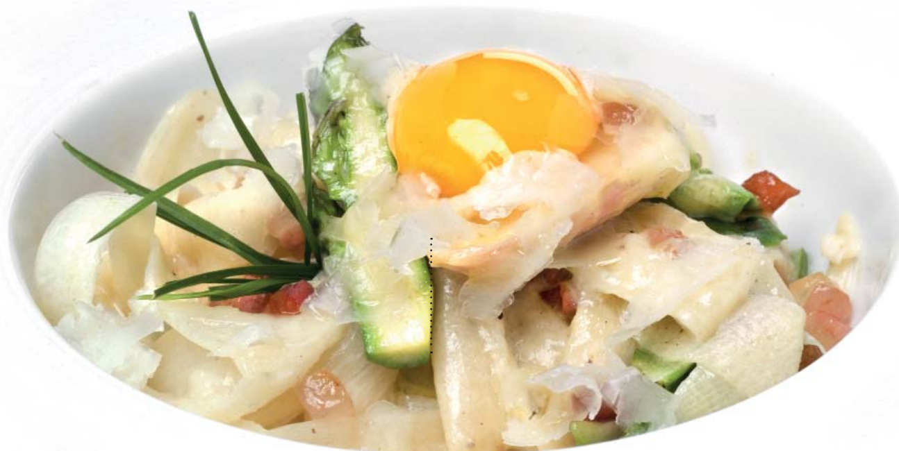
Asparagus noodles "carbonara" Tagliatelles d'asperges à la carbonara

Sammic s'est associé à Fleischmann's Cooking Group pour offrir des services de formation et de consultation à nos Distributeurs et Utilisateurs. Nous disposons d'un Chef Corporatif et d'un département Cuisine, depuis lequel nous offrons des services standard et sur mesure sur place, chez le client, ou bien on-line. Ces services vous aideront aussi bien à obtenir le meilleur de nos équipements, qu'à choisir le ou les équipements qui s'adaptent le mieux à vos besoins.