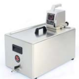
Insulated tank and accessories / Bac isolé et accessoires