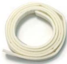
Probe foam seal / Membrane pour sonde