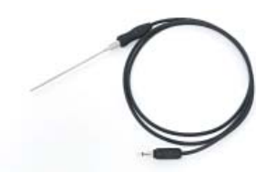
Needle probe / Sonde