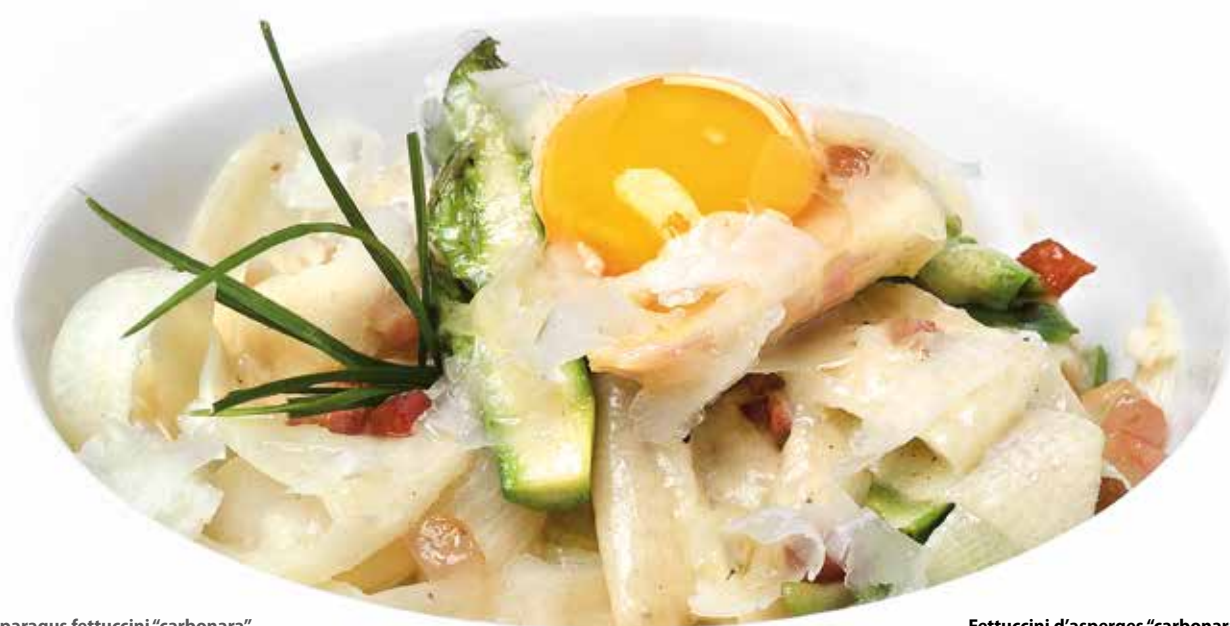
Asparagus fettuccini "carbonara" · White asparagus 85°C / 185°F, 30min · Green asparagus 85°C / 185°F, 10min

Sammic s'est associé à Fleischmann's Cooking Group pour offrir des services de formation et de consultation à nos Distributeurs et Utilisateurs. Nous disposons d'un Chef Corporatif et d'un département Cuisine, à travers lequel nous offrons des services standard et sur mesure sur place, chez le client, ou bien on-line. Ces services vous aideront aussi bien à obtenir le meilleur de nos équipements, qu'à choisir le ou les équipements qui s'adaptent le mieux à vos besoins.